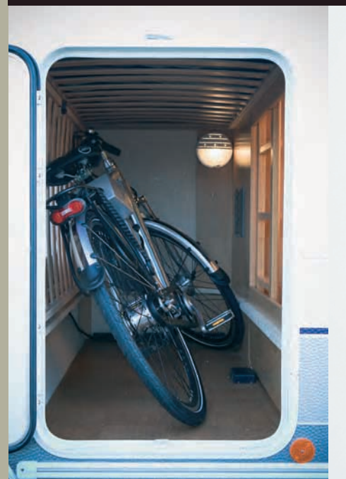
Met moeite krijgen we één fiets