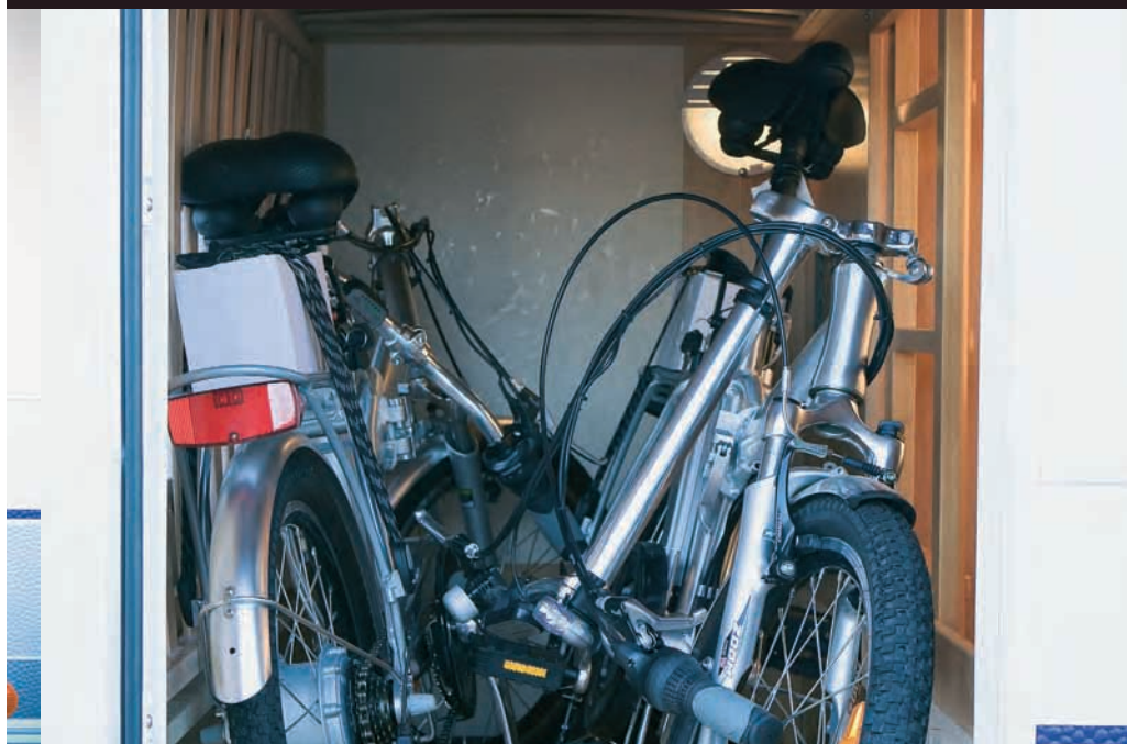
in de garage. Twee gaat ook, als ze maar niet te groot zijn